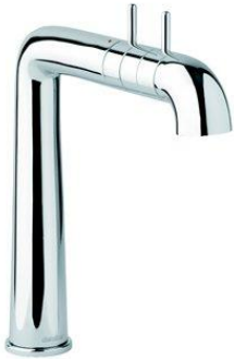
Artikkelnummer: 73000 Damixa Apex kjøkkenkran